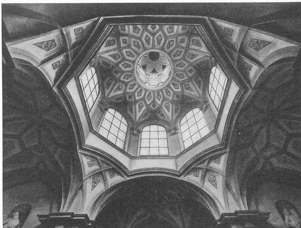
Bild 5. Die Kuppel der Visitationskirche in Freiburg