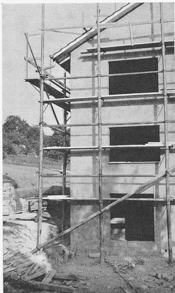
Gerüst mit Laufgang für Dachgesimsarbeiten

Die übliche Praxis, die schnell zur Verwirklichung des Projektes führt, ist die des geringsten Widerstandes und geht folgendermassen vor sich: In der Altstadt wird «altstädtisch», d. h. irgendwie das neue Gebäude der Nachbarschaft «im Stil» angepasst, gebaut. Unter «altstädtisch» versteht man grosso modo Giebel- oder Walmdach, kleine Fensterteilung, Fensterbrüstungen, Gesimse, alles wenn möglich Bruch- oder Sandstein, oder eben so wirkender Kunststein oder angestrichener Beton. Welcher Stil dabei verwendet wird, ist eigentlich egal, Hauptsache, dass dem neugeprägten Mischmasch aus sämtlichen Stilelementen der Vergangenheit entsprochen wird. Das gleiche Ziel des Angleichens kann man auch durch das blosse Wiederaufkleben der alten Fassade vor Stahlskelette usw. erreichen. Das alles ist landläufige, nicht nur geduldete, sondern empfohlene Architektur.