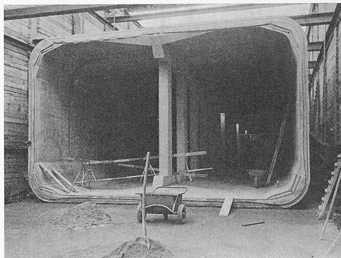
Bild 19. Zweigleisiges Tunnelfertigteil in Spannbeton