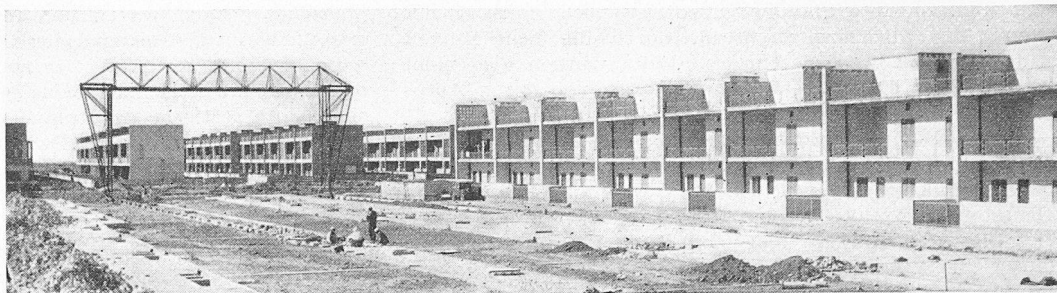
Bild 3. Siedlung für Familien mit niedrigem Einkommen in West-Bagdad

weder über Wasser, Kanalisation noch Elektrizität verfügen. Die Bewohner leben im Winter im feuchten Schmutz und im Sommer im Staub. Aber auch von den übrigen Wohnstätten, die mit Lehmziegeln, Backsteinen oder anderem Material gebaut sind, entspricht ein grosser Teil nicht mehr den heutigen Wohnanforderungen. Der