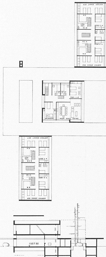
Erdgeschoss, rechts erstes Obergeschoss, unten Südansicht, Masstab 1:600