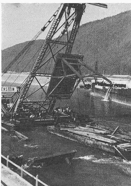
Bild 2. Versetzen eines Stauschildes

2. Kastenfangdamm aus Stahlpundwänden (Larssen IV, 12÷14 m) und Kiesfüllung. Kastenbreite etwa 0,8 der freien Höhe; zwei Reihen Anker, deren untere Reihe in vor dem Rammen innen angeschweisste Augen unter Wasserhaltung eingebaut und mittels Spannschlössern angezogen wird; die Gewinde der Anker sind aufgepresst, nicht eingeschnitten. Ein vorgeschütteter Kiesdamm diente als Rammebene. Nach Trockenlegung der Baugrube wurde, wo nötig, der innere Spundwandfuss durch eine im Fels kräftig verankerte Eisenbetonschwelle 65/70 cm gesichert. Auffahrtsrampen konnten zweckmässig an solche Kastenfangdämme angelehnt werden. Es wurden hievon 400 m' ausgeführt. Die Verbindung fertiger Bauwerke, wie Wehrpfeiler, mit anderen Baugrubenumschliessungen wurden stets in solcher Weise ausgeführt, indem man in der zeitlich vorausgegangenen Baugrube die Anschlüsse im Trockenem herstellte.