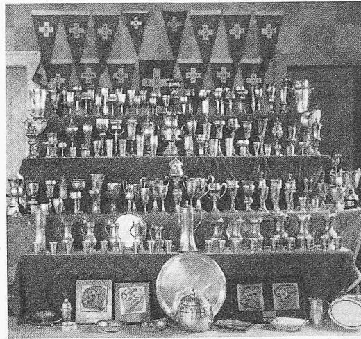
Nordiska-Trophäen: hinten die Meisterschaftsfähnchen im Rudern und vorn Preise von den Schweizer Ski-meisterschaften

Leben geschlossen, und aus dem Gästebuch im Nordiska Club-hause kann man ersehen, dass viele damalige ETH-Studenten aus «Heimweh» nach der Schweiz die Stadt an der Limmat wieder besuchen.