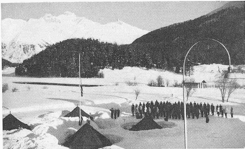
Winterolympiade St. Moritz 1948, Nordiska-Zeltlager mit etwa 100 Studenten. Unterkunft in norwegischen Armeezelten und Verpflegung aus schweizerischen Armeefeldküchen