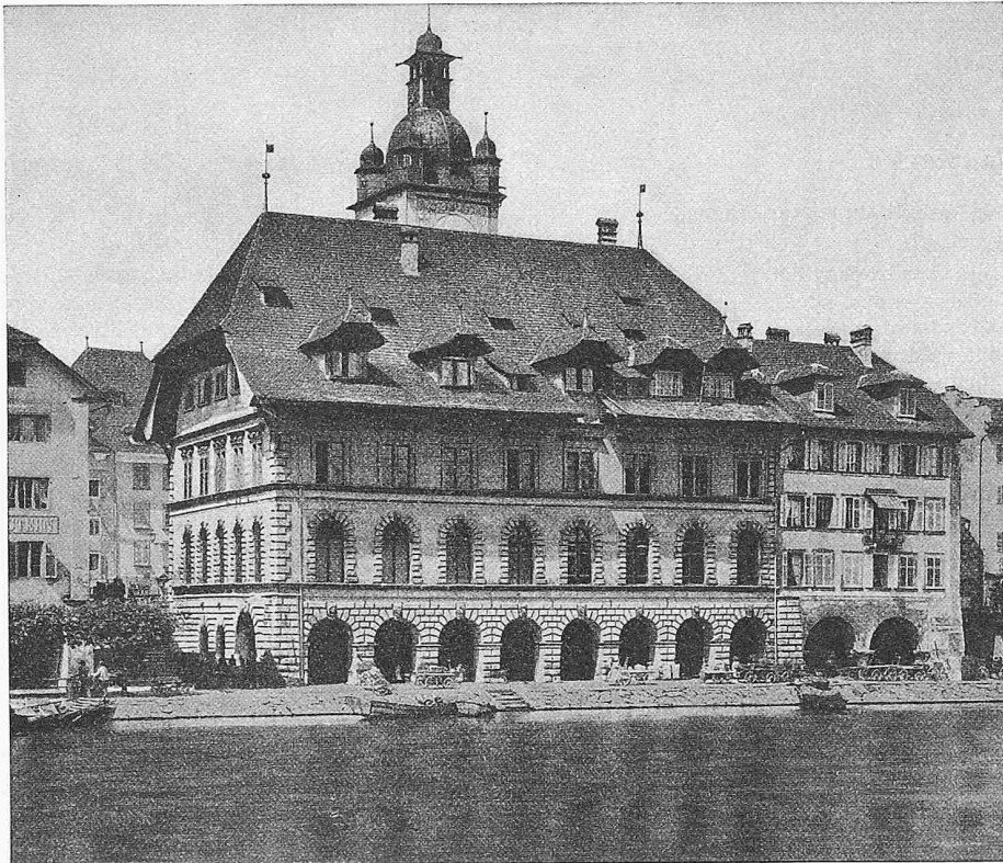
Das Luzerner Rathaus, gesehen von der Reussseite, rechts Haus am Rhyh