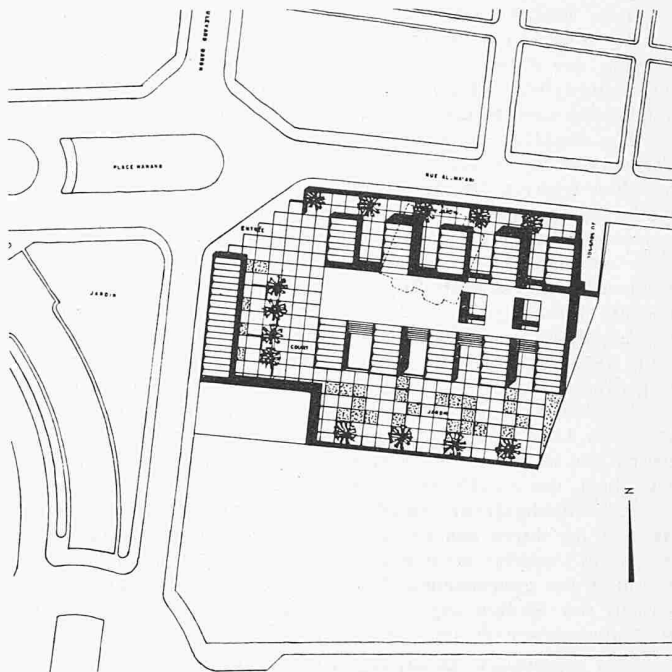
Lageplan 1 : 2500

Streifen konnten dann abgelöst, gereinigt und in der richtigen Reihenfolge aneinandergesetzt werden. Sicherheitshalber wurden während dem ganzen Arbeitsvorgang jeweils photographische Aufnahmen der freigelegten Lagen gemacht. Von den eingepprägten, über 3000 Schriftzeichen gingen nur 5 % infolge schon vor der Behandlung gebrochenen Teilen verloren und nur 2 % der verbliebenen Schriftzeichen zeigten undeutliche Konturen. Kein Schriftzeichen wurde beim angewendeten Verfahren beschädigt, so dass den Archäologen und Schriftkundigen ein sozusagen intaktes Material zur weiteren Bearbeitung überlassen werden konnte.