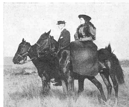
Bild 4. Sein Besitztum war so gross, dass man 1½ Stunden zu Pferd brauchte bis zum Nachbarn