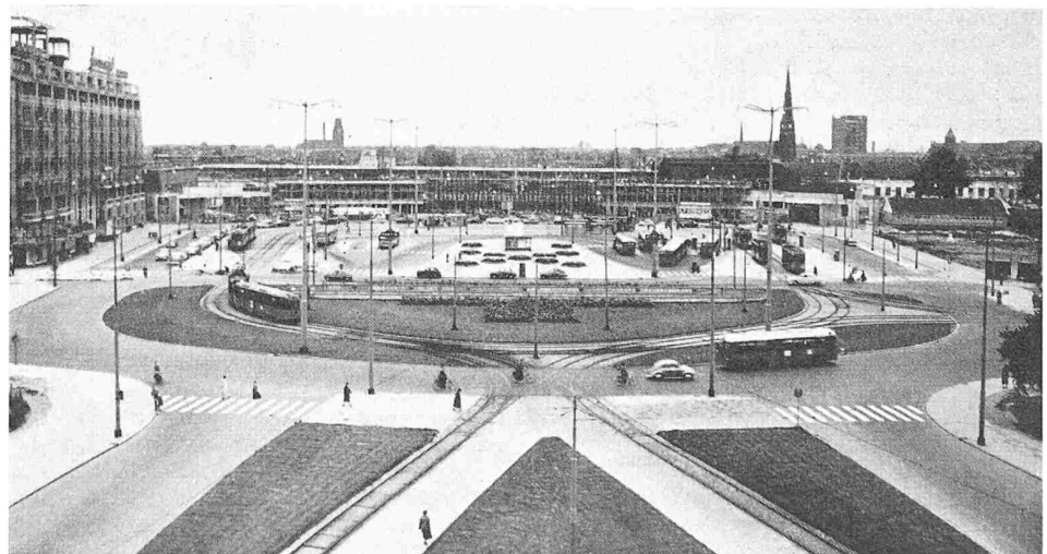
Bild 4. Der Bahnhofplatz von Rotterdam im September 1955