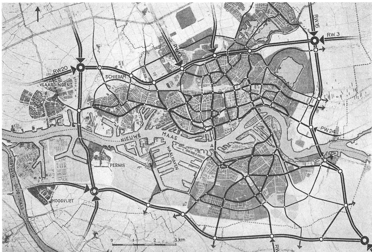
Bild 1. Rotterdam und Umgebung mit den geplanten Hauptstrassenzügen, Masstab 1:100 000. A = Maastunnel, B = geplante Strassenbrücke

Die Teile dieser ganzen Agglomeration von etwa 800 000 Einwohnern werden untereinander verbunden durch Strassen parallel und quer zum Fluss (Bild 1). Der Plan für den