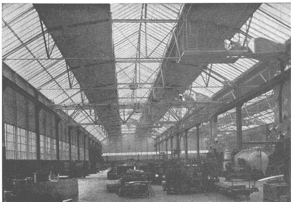
Produktionshalle, Krangerüst in Leichtmetall