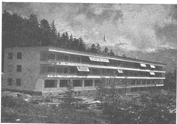
Sanatorium Valaisan Montana Raymond Wander, dipl. Architekt, Zürich und Bern