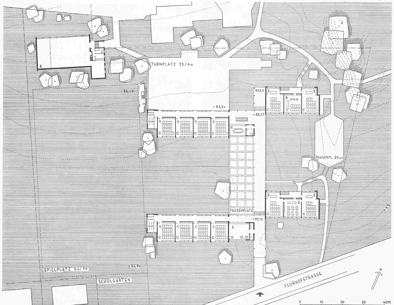
Primarschulhaus im Grossacker, Erdgeschossgrundriss M 1:1000. Legende: 1 Normalklasse, 2 Abschlussklasse, 3 Hort, 4 Lehrer, 5 Handfertigkeit Knaben, 6 Handarbeit Mädchen, 7 Turnhalle