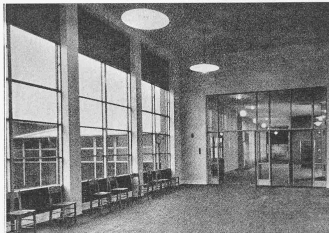
Bild 2. Primarschule Whitmore Park, England

Der Bau der Schleusenanlagen wurde mit folgendem Aufwand durchgeführt: rd. 800 000 m 3 Aushub, 270 000 m 3 Beton, 142 000 m 2 Schalung und rd. 3000 t Armierungseisen. Die Betonierungsarbeiten, die im Jahre 1950 mit 150 000 m 3 eingebrachtem Beton ihren Höhepunkt erreichten, wurden mit den modernsten Mitteln durchgeführt. Transportbänder führten die aufbereiteten Kies- und Sandkomponenten in die Silos der Betonfabrik, worauf sie in Dosierapparaten gemischt und in drei Betonmaschinen von je 1 m 3 zu Beton verarbeitet wurden. Der Zement wurde drei Silos zu 500 t entnommen. Die Einbringung des Betons erfolgte mit drei hölzernen Dienstbrücken, fünf Turmdrehkränen und einem über 220 m gespannten Kabelkran, die alle den Erfordernissen des Baufortschrittes gemäss auf dem Schleusenareal installiert worden waren. Die Füllung und Entleerung der Schleusenammern erfolgen vermittelst vier im Fundamentbankett der Kammern in Längsrichtung verlaufenden Stollen, von denen je zwei eine Kammer bedienen. Nach zehnmonat-