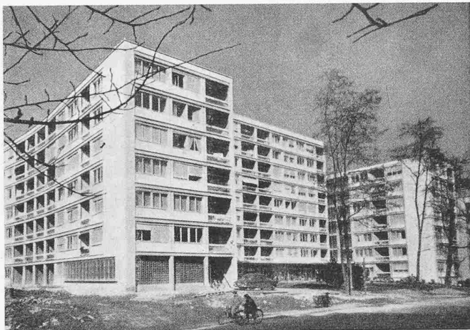
Bild 1. Malagnou-Parc, Genf, 1951

werkes Kembs bot der Maschinenpark der USA-Ausrüstung entsprechend ein vollständig verändertes Bild. Die damalige Charakteristik war Kohle, Dampf und Eisenbahnen, jetzt aber Gasöl, Elektrizität und Pneufahrzeuge.