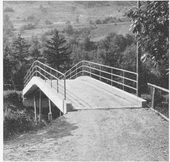
Bilder 4 und 5. Die Brücke von 1954: Stahlkonstruktion mit Fahrbahnplatte aus Eisenbeton

Der Rollschemelbetrieb, d. h. die Ueberfuhr gedeckter Normalspurgüterwagen von Chur bis nach Thusis bedingte neuerdings die Erweiterung der lichten Höhe um 1,30 m, was nur durch eine Neukonstruktion möglich war.