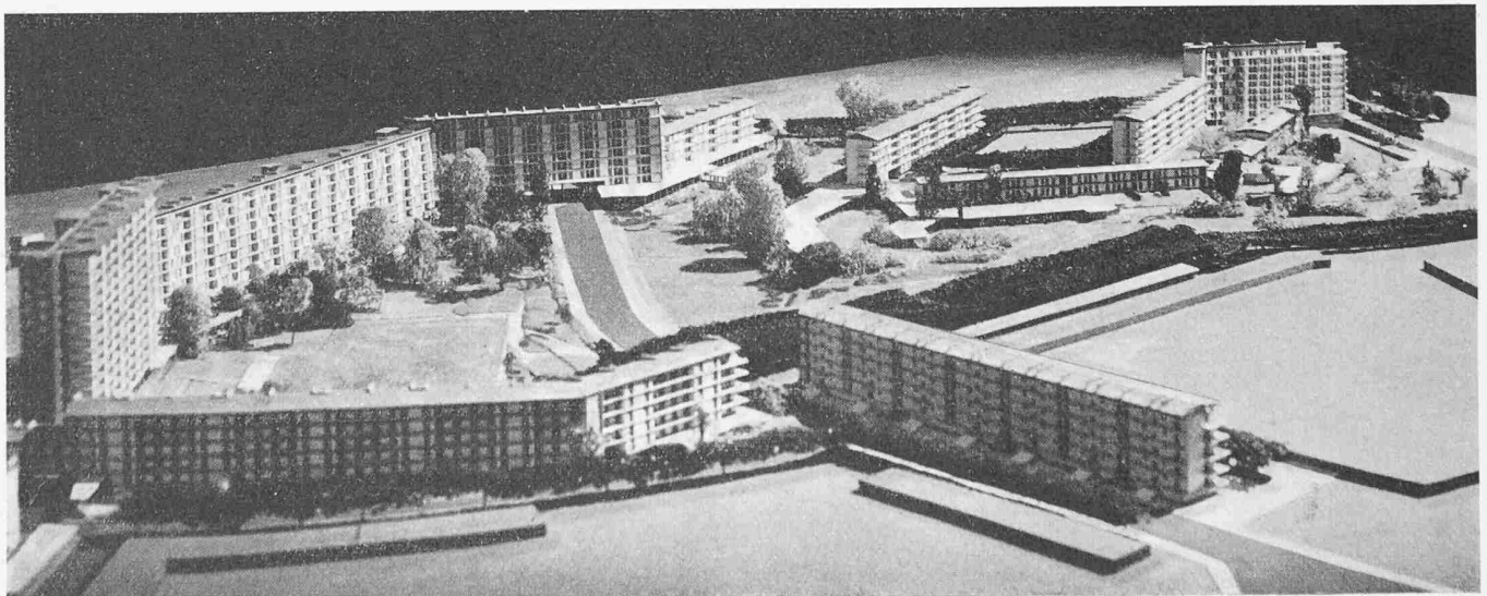
La maquette du projet d'exécution, vue du Sud-Ouest

Mais, pour mieux comprendre pourquoi ce projet a dû être réalisé dans un délai de 15 mois avec des moyens et des méthodes pour la première fois appliqués en France, il faut connaître les motifs sociaux de l'œuvre. A peu près 500 habitants, sinistrés pendant la guerre et logés après la fin des hostilités dans des maisons réquisitionnées par les autorités dans la ville de Kehl, ont dû être évacués après la conclusion d'un accord franco-allemand qui restituait à l'administration du Pays de Bade sa souveraineté civile dans cette tête de