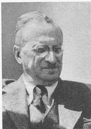
E. ALTENBURGER ARCHITEKT