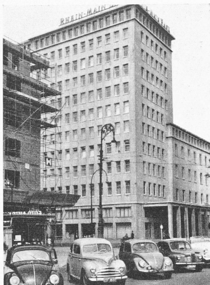
Bild 6. Das neue Gebäude der Rhein-Mainbank am Friedrich-Ebert-Platz. Konventionelle, aber gut proportionierte Architektur