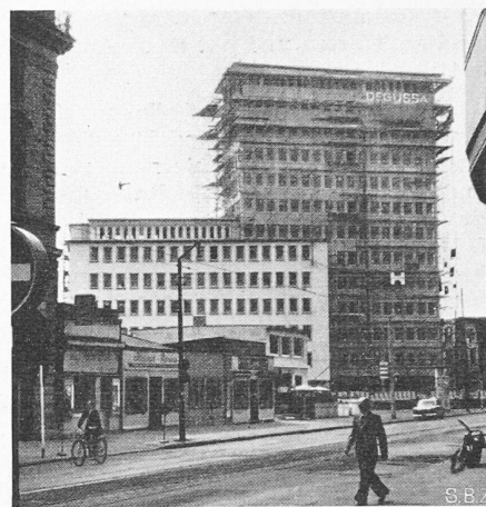
Bild 8. Dussa-Gebäude. Hochhaus mit angliedertem, niedrigerem Geschäftstrakt. Gute städtebauliche Platzwirkung

die Beschleunigung des Verkehrs bedeutet, kann man in Frankfurt auf sehr angenehme Weise selbst erfahren, wenn man es als Zürcher noch nicht aus eigener Anschauung wusste.