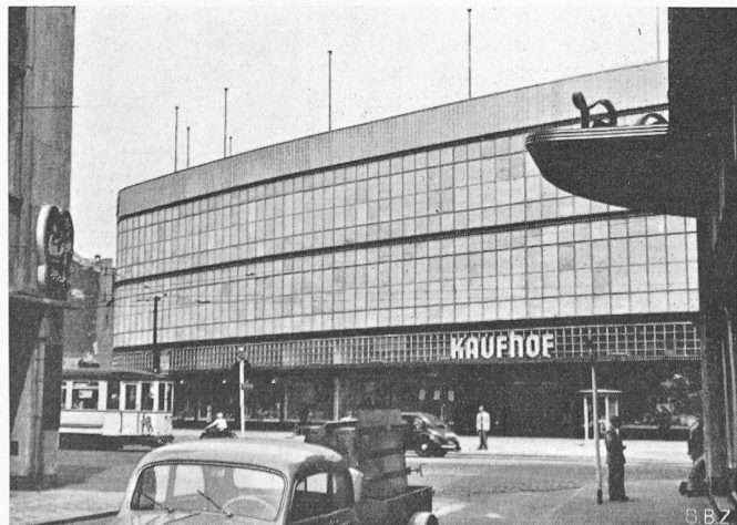
Bild 9. Modernstes Kaufhaus. Keine Öffnungen nach aussen. Maximaler Lichteinfall. Klimaanlage regelt Temperatur und Feuchtigkeit der Luft im Innern