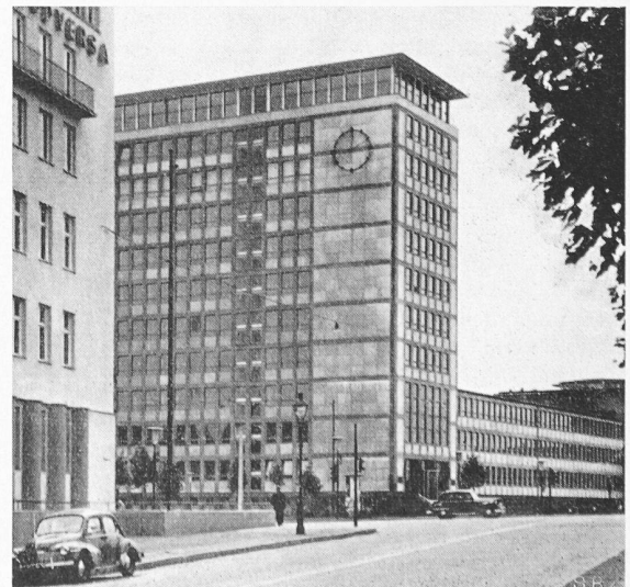
Bild 1. Hochhäuser am Mainufer. In der Nähe befinden sich weitere Hochhäuser, die dem Ufer einen beherrschenden Ausdruck verleihen. Hier wäre ein «Mehr» in Zukunft ein «Zuviel»