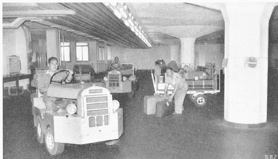
Bild 43. Gepäcktransport im Gepäckumschlagraum, Kellergeschoss