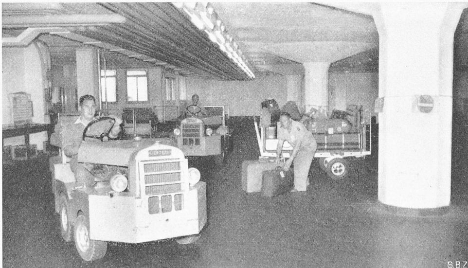
Bild 43. Gepäcktransport im Gepäckumschlagraum, Kellergeschoss