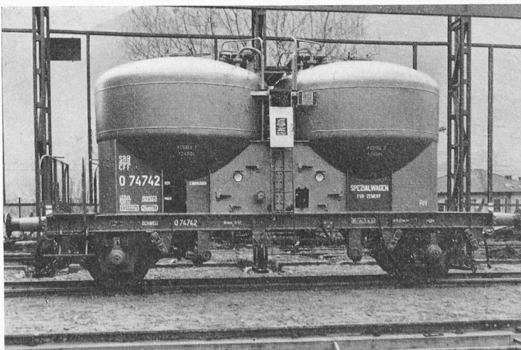
Zementtransportwagen der SBB (aus «SBB-Nachrichtenblatt» 1953, Nr. 6).