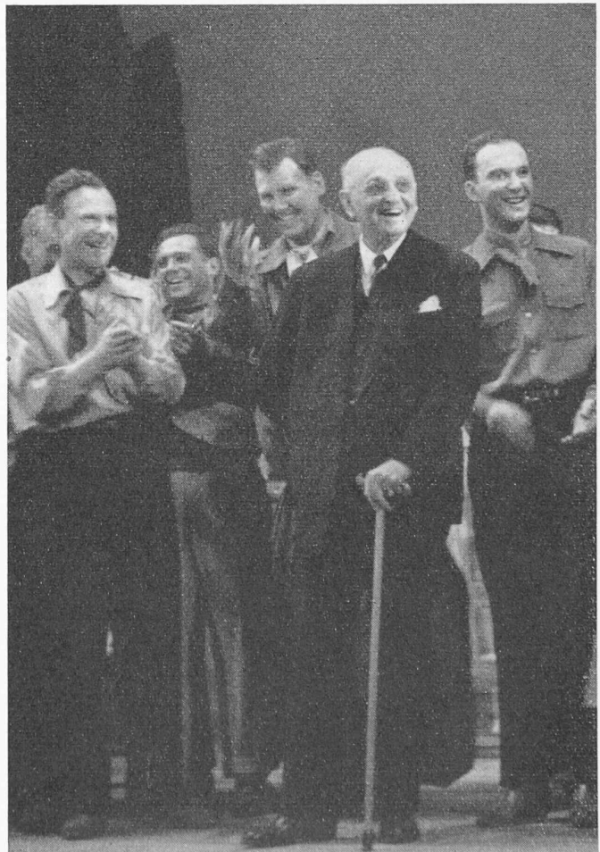
Frank Buchman inmitten seiner jungen Freunde, nach einer Vorstellung von «Jotham Valley» in New Delhi. Mit ihren Theaterstücken gewinnen sie überall Menschen für den Kampf um die neue Welt.

Während viele Männer der Moralischen Aufrüstung im Kriegsdienst der alliierten Nationen an der Front und in Untergrundbewegungen kämpften, schuf Frank Buchman in Mackinac im Staate Michigan ein Ausbildungszentrum, wo Tausende aus allen Schichten des amerikanischen Lebens und Vertreter vieler Nationen zusammenkamen, um in der Moralischen Aufrüstung als der inspirierten Ideologie für die Demokratie geschult zu werden. Gleichzeitig reisten Mannschaften der Moralischen Aufrüstung von Küste zu Küste in Amerika und Kanada, und die Wirkung ihrer Arbeit, vor allem in den Industriezentren, war derart, dass Senator Harry S. Truman sagte: «Ich kann mir keinen industriellen Engpass denken,