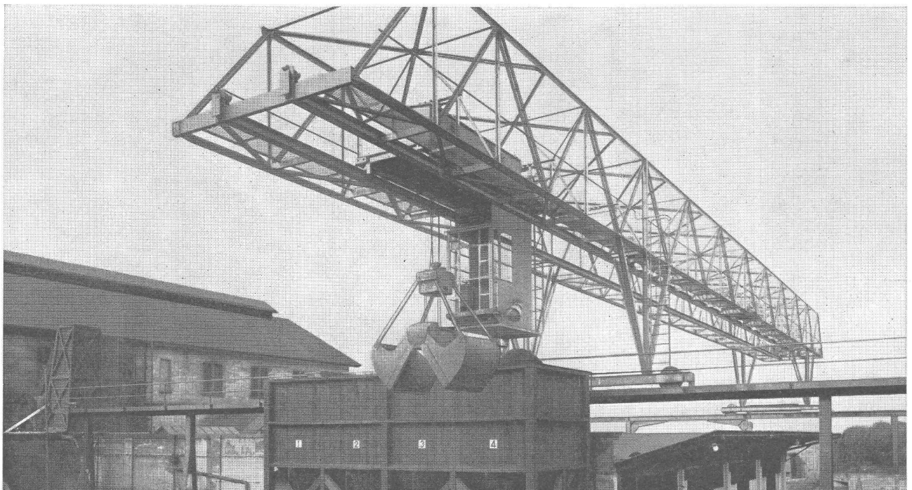
Verladebrücke in Schweisskonstruktion 2,5 t Tragkraft, 46 m Länge