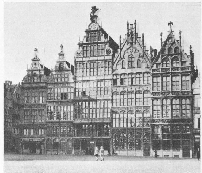
Bild 1. Niederfränkische verglaste Skelettbauten aus vier Jahrhunderten am Grossen Markt in Antwerpen

Eine Maschinenfabrik, eine Spinnerei oder Weberei wird auch in unserm Alpenraum als Stahlbetonskelett mit viel Glas gebaut, ohne dass man sich deshalb als besonders modern vor kommt. Bei einem neuzeitlichen Wasserkraftwerk ist diese