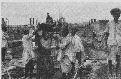
Bild 21. Nangal-Sperre, Betontransport: Auf- und Abtransport durch Männer, Transport durch Frauen vermittelst flacher, auf dem Kopf getragener Blechbecken. Die Frauen tragen meist Schleier.

Die Zeugen einer hoch entwickelten Wasserbautechnik reichen insbesondere in Südindien noch weiter zurück. In Ceylon bestehen heute noch eine ganze Reihe von Dämmen mit Ueberlaufkanälen und Abschlussorganen, die auf das 4. Jahrhundert v. Chr. zurückgehen sollen und an denen Inschriften bezeugen, dass sie im 12. Jahrhundert n. Chr. von König Parakrama Bahu, der ein grosser Wasserbauer gewesen sein muss, erneut instandgestellt worden sind. Auch in der jüngeren Vergangenheit sind zahlreiche bedeutende Bauten erstellt worden; wir nennen als Beispiel den bei Hardwar beginnenden Ganges-Kanal. Jedoch hat das Bau-