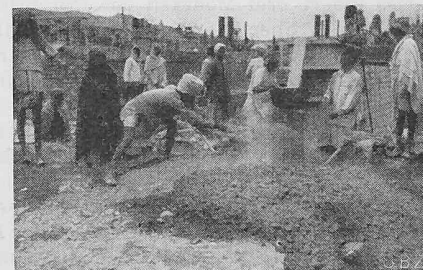
Bild 23. Nangal-Sperre, Mischen des Betons; im Bilde festgehalten die Zementzugabe.