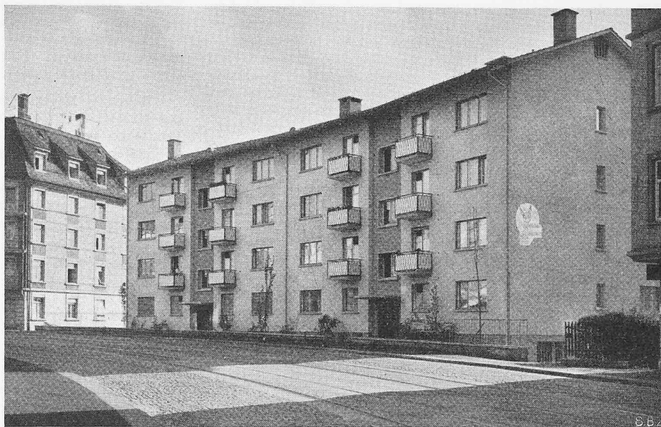
Bild 6. Fassade an der Forchstrasse aus Norden

Schwellen sind aus Holz und stammen zum Teil aus Kanada, werden aber auch eingeführt. Das Holz der Gegend ist krumm gewachsen und deshalb nur teilweise brauchbar. Die totale Bauzeit beträgt voraussichtlich drei Jahre.