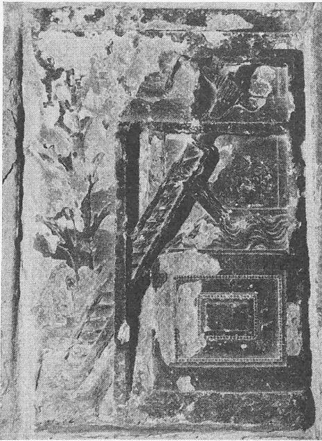
Bild 4. Archimedische Schnecke, bestehend aus einem Rohr mit innen wendeltreppenartig angebrachter Schraube, die durch Umdrehung die Flüssigkeit hebt und oben austreten lässt. Das Rohr ist der Deutlichkeit halber aufgeschlitzt dargestellt.