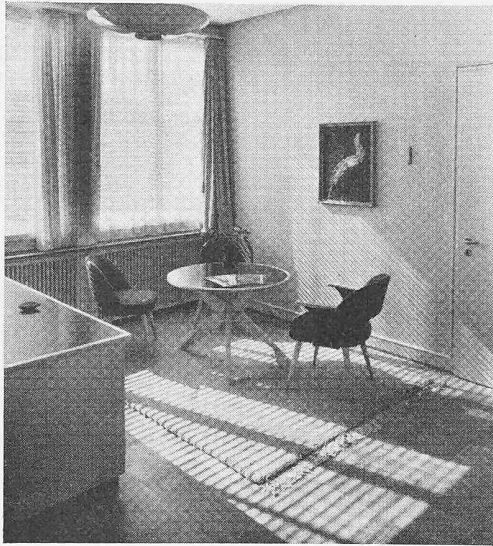
Bild 15. Direktionszimmer

Eine Holztagung in Salzburg findet vom 16. bis 21. Juni 1952 statt. Veranstalter sind die Oesterreichische Gesellschaft für Holzforschung (OeGH), die Deutsche Gesellschaft für Holzforschung (DGfH) und die LIGNUM, Schweizerische Arbeitsgemeinschaft für das Holz. Zweck ist die Förderung des Zusammenwirkens der an der Holzforschung beteiligten Wissenschaftler und interessierten Praktiker und die Orientierung über neue Erkenntnisse und Möglichkeiten bei der Verwertung des Holzes. Dieser Zweck soll durch Vorträge und Be-