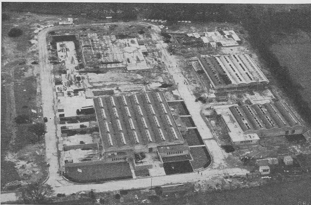
Bild 15. Crawley, Industriegebiet mit genormten, mietbaren Fabrikgebäuden