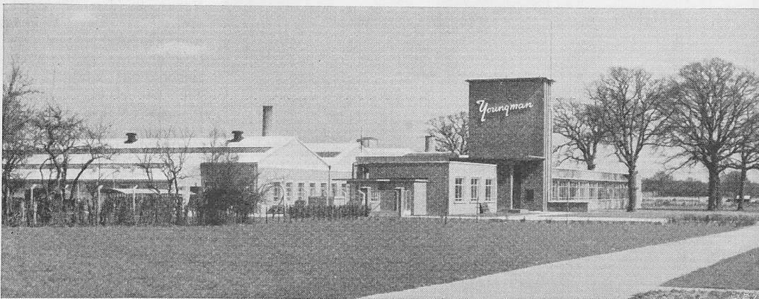
Bild 14. Crawley, Fabrikgebäude im Baurecht erstellt