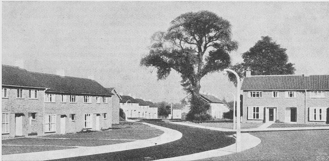
Bild 11. Harlow, Chippingfield. Im August 1950 bezogene Häuser mit zwei bzw. drei Schlafzimmern