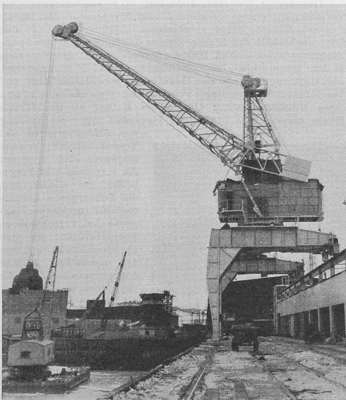
Bild 34. Halbportalkran mit Ausleger aus Aluminium von 4,5 t Tragkraft im Hafen von Port Alfred

stand bei Flussbeginn inhomogener Spannungszustände hinzudeuten, vgl. Kapitel IV Festigkeitstheoretische Betrachtungen der Veröffentlichung: Die Berechnung fester Flanschverbindungen von Autoklaven, Rohrleitungen u. dgl., «Schweizer Archiv», 8. Jahrgang, Nr. 9, Sept. 1942.