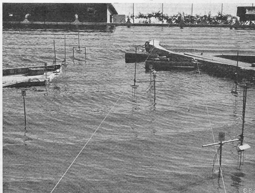
Die «Station d'essais maritimes» des Hydraulischen Laboratoriums