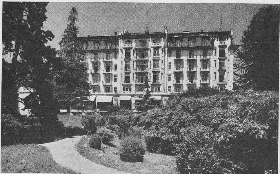
Das Hauptgebäude der EPUL an der Avenue de Cour in Lausanne