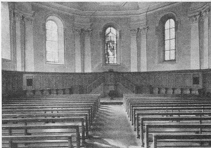
Ansicht gegen die Kanzel vor der Restauration (vgl. Tafel 21)

Noch während der Bauzeit wurde auf Anregung von Dr. Stettler beschlossen, auch die bestehende Emporenbrüstung abzutragen und durch eine neue, dem barocken Charakter entsprechende, zu ersetzen. Im Verlauf der Umbauarbeiten nahm die Orgel, trotz allen möglichen Vorkehrungen zu ihrem Schutze, erheblichen Schaden. Eine gründliche Reinigung und eine Neuintonierung wurden notwendig. Diese zusätzlichen Arbeiten und die Ausgaben für die Aussenrenovation und die Umgebungsarbeiten erforderten einen neuen