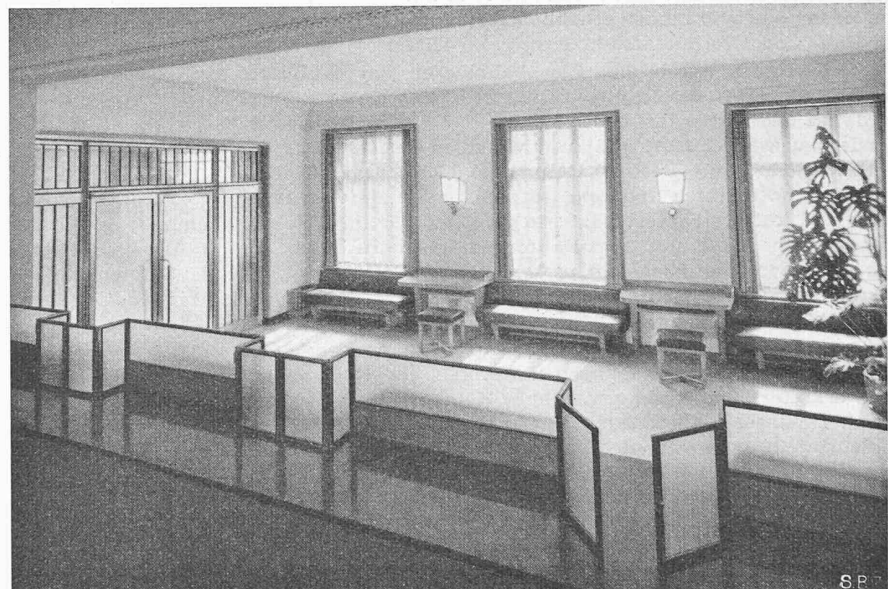
Bild 14. Schalterhalle der Filiale Grenchen der Solothurner Handelsbank

Fensterwänden versehen, bei denen dies aus betrieblichen Gründen unbedingt erforderlich ist. Hingegen wurde für alle Maschinen, bei denen dies möglich war, auf die Umbauung verzichtet oder höchstens eine leichte Betonplatte als Regen- und Sonnenschutz angebracht. Die von Architekt F. L. Whitney mit grossem Geschick entworfene Anlage ergibt sowohl am Tage wie nachts in beleuchtetem Zustande ein äusserst eindrucksvolles Bild fortschrittlicher Industrieau-Gestaltung.