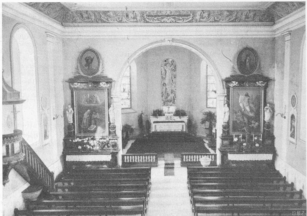
Bild 3. Chorpattie vor der Umgestaltung