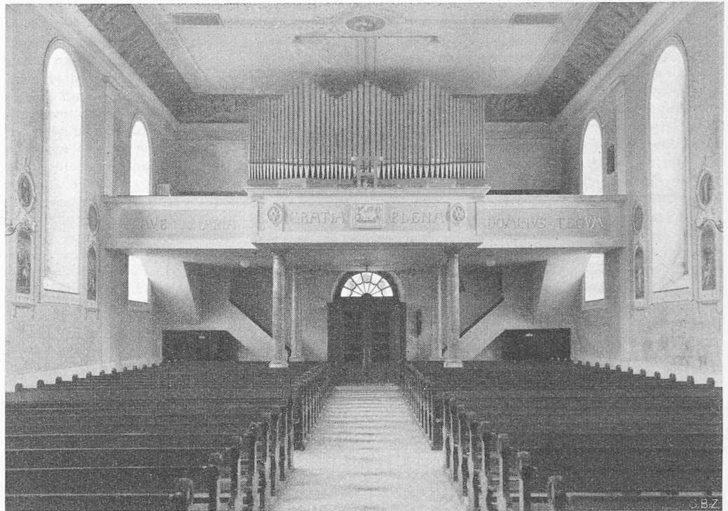
Bild 1. Katholische Pfarrkirche Biberist, Schiffrückwand vor 1949