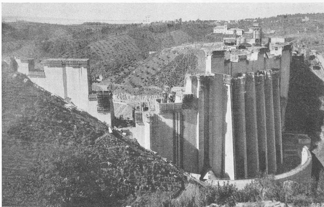
Bild 1. Stau-mauer Castelo do Bode, Portugal, am 25. Febr. 1950. Die Wasserseite wird gebildet durch einen 300 \text{ m} weit gespannten Vertikal-Zylinder, r = 150 \text{ m} , mit über 100 \text{ m} freier Höhe. Die vorgebauten Rechenbahnen, an deren Fuss die Rechen vor den drei Wasserfassungen liegen, haben die Höhe erreicht, wo die Aufbauten für Revision und Bedienung von Rechen und Schützen ansetzen. Beidseitig der Wasserfassungen liegen die Grundablässe, darüber deren Schützen-Bahnen. In den Bahnen sind die Belüftungen der Einläufe untergebracht. Die Einläufe bleiben geschützt durch die Gewölbemauer des Fangdammes. Die Stau-mauer hat in den obersten Blöcken die volle Höhe erreicht; der Hochwasserüberfall in Eisenbeton folgt nach

Die Dosierung des Darex ist gelegentlichen Störungen unterworfen, da Kupfer, Messing, Bronze und Eisen angefressen werden, was den Schwimmer im Messgefäss und Hahnen beschädigt. Fehlt Darex, so wird die Mischung unverarbeitbar, die Druckluftvibratoren dringen nicht mehr, die elektrischen nur mühsam in den Beton ein. Mit zuviel Darex zerfliesst der Beton. Darex-Beton verlangt auch eine auf 2 \text{ l/m}^3 genaue Wasserdosierung. Der richtige Darex-Zusatz wird an den Betonproben im Laboratorium laufend kontrolliert durch Prüfung des Luftgehaltes mittels des ACME Entrained Air Meter (Zimmermann, Chicago). Der durch das 1\frac{1}{2} " Sieb gefallene Beton-Anteil wird im Messtopf eingerüttelt; nach Aufschrauben der Instrumentenhaube wird Wasser eingefüllt und Luft eingepumpt, bis das Manometer den vorgeschriebenen