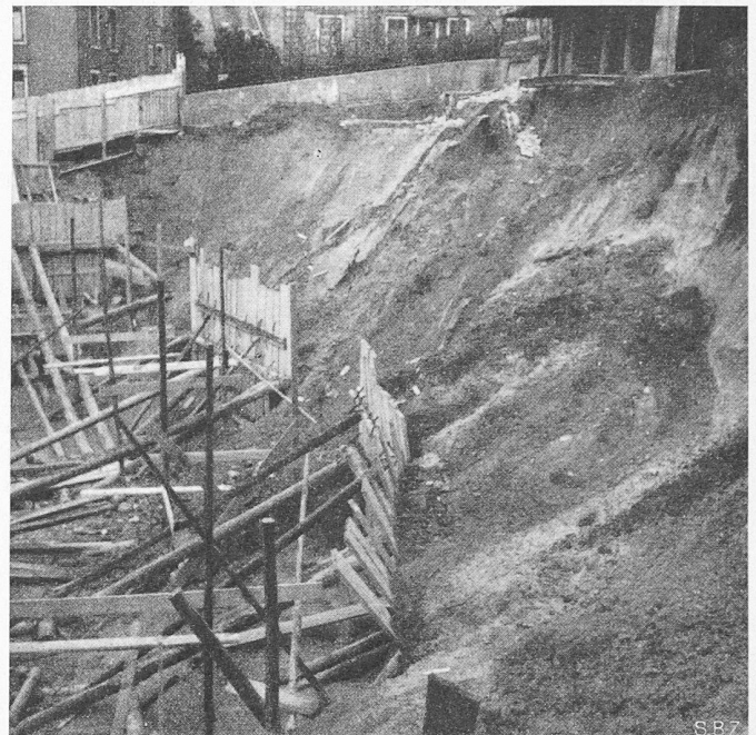
Bild 2. Zustand der Baugrube am 10. Januar 1948

Die Wiederherstellung der Strassenbrücken an den anderen Hauptverkehrslinien wurde in zwei Stufen ausgeführt: zuerst ein hölzernes Provisorium, dann die endgültige Konstruktion. Für die kleineren Spannweiten hat man die gesprengten Teile gehoben und ergänzt. Für die grösseren Spannweiten von 20 bis 30 m wurden Typenbrücken entwickelt, die einen geringen Stahlaufwand benötigten: leichte geschweisste Stahlelemente zu Fachwerkträgern zusammengeschrabt, Fahrbahn aus Holz. Verbundkonstruktionen wurden sehr viel angewendet, da sie eine rasche und leichte Ausführung erlaubten. Trotz des 50—60 % höheren Stahlaufwandes im Vergleich mit Eisenbetonbalkenbrücken von 20 bis 30 m Spannweite blieben sie wirtschaftlicher (erklärlich durch die Wiederverwendung der gesprengten Teile in der Verbundbauweise). Für Spannweiten über 30 m wurden Bogenbrücken mit Zugband angewendet. Die Zalaidvég-Brücke erhält einen vollständig geschweissten Stahlbogen von 42,08 m Spannweite ( f/1 = 1/5,2 ) und eine Fahrbahnplatte aus Eisenbeton von