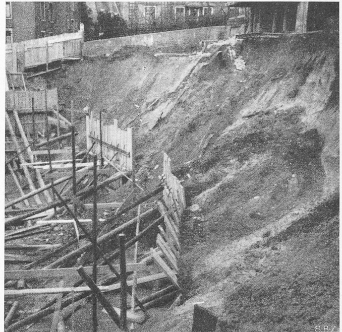
Bild 2. Zustand der Baugrube am 10. Januar 1948

Die Wiederherstellung der Strassenbrücken an den anderen Hauptverkehrslinien wurde in zwei Stufen ausgeführt: zuerst ein hölzernes Provisorium, dann die endgültige Konstruktion. Für die kleineren Spannweiten hat man die gesprengten Teile gehoben und ergänzt. Für die grösseren Spannweiten von 20 bis 30 m wurden Typenbrücken entwickelt, die einen geringen Stahlaufwand benötigten: leichte geschweisste Stahlelemente zu Fachwerkträgern zusammengeschraubt, Fahrbahn aus Holz. Verbundkonstruktionen wurden sehr viel angewendet, da sie eine rasche und leichte Ausführung erlaubten. Trotz des 50—60 % höheren Stahlaufwandes im Vergleich mit Eisenbetonbalkenbrücken von 20 bis 30 m Spannweite blieben sie wirtschaftlicher (erklärlich durch die Wiederverwendung der gesprengten Teile in der Verbundbauweise). Für Spannweiten über 30 m wurden Bogenbrücken mit Zugband angewendet. Die Zalaidvég-Brücke erhält einen vollständig geschweissten Stahlbogen von 42,08 m Spannweite ( f/l = 1/5,2 ) und eine Fahrbahnplatte aus Eisenbeton von