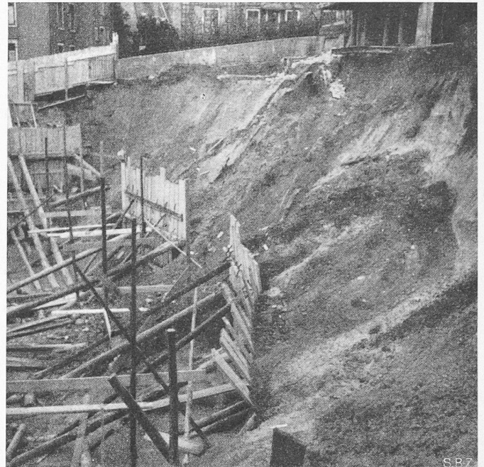
Bild 2. Zustand der Baugrube am 10. Januar 1948

Die Wiederherstellung der Strassenbrücken an den anderen Hauptverkehrslinien wurde in zwei Stufen ausgeführt: zuerst ein hölzernes Provisorium, dann die endgültige Konstruktion. Für die kleineren Spannweiten hat man die gesprengten Teile gehoben und ergänzt. Für die grösseren Spannweiten von 20 bis 30 m wurden Typenbrücken entwickelt, die einen geringen Stahlaufwand benötigten: leichte geschweisste Stahlelemente zu Fachwerkträgern zusammengeschrabt, Fahrbahn aus Holz. Verbundkonstruktionen wurden sehr viel angewendet, da sie eine rasche und leichte Ausführung erlaubten. Trotz des 50—60 % höheren Stahlaufwandes im Vergleich mit Eisenbetonbalkenbrücken von 20 bis 30 m Spannweite blieben sie wirtschaftlicher (erklärlich durch die Wiederverwendung der gesprengten Teile in der Verbundbauweise). Für Spannweiten über 30 m wurden Bogenbrücken mit Zugband angewendet. Die Zalaidvég-Brücke erhält einen vollständig geschweissten Stahlbogen von 42,08 m Spannweite ( f/1 = 1/5,2 ) und eine Fahrbahnplatte aus Eisenbeton von