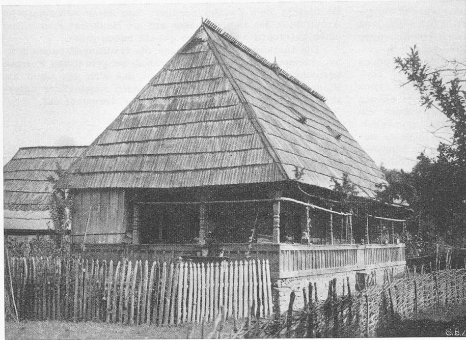
Bild 2. Die Ausgeglichenheit der Formen beim rumänischen Bauernhaus ist ebenso wohltuend wie beim schweizerischen

wirtschaft befassen, kurz orientiert. Anschliessend an die Sitzung fand eine Besichtigung der Bauarbeiten für das neue Kraftwerk Ottmarsheim statt.