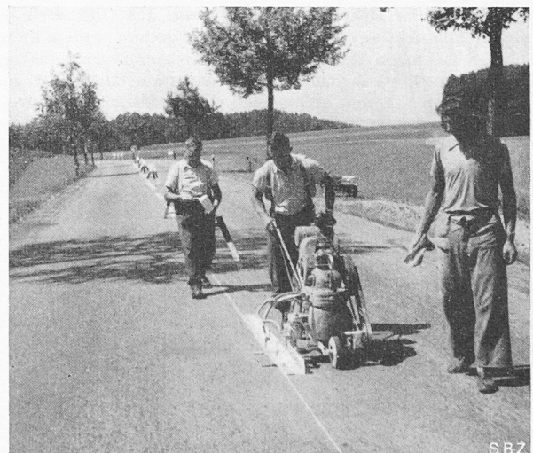
Signalisierung der Strecke Zürich-Winterthur: Aufspritzen der weissen Linien mit dem amerikanischen «Streetmarker», einer motorisierten Farbspritzenanlage

Es ist bekannt, dass Gefahrensignale, die durch Verwendung von reflektierendem Material im Scheinwerferlicht stark aufleuchten, den Automobilisten bei monotoner Nachtfahrt sicherer beeinflussen als gewöhnliche Signale. Ausserdem gelten auch hier ähnliche Ueberlegungen wie für die Leit-