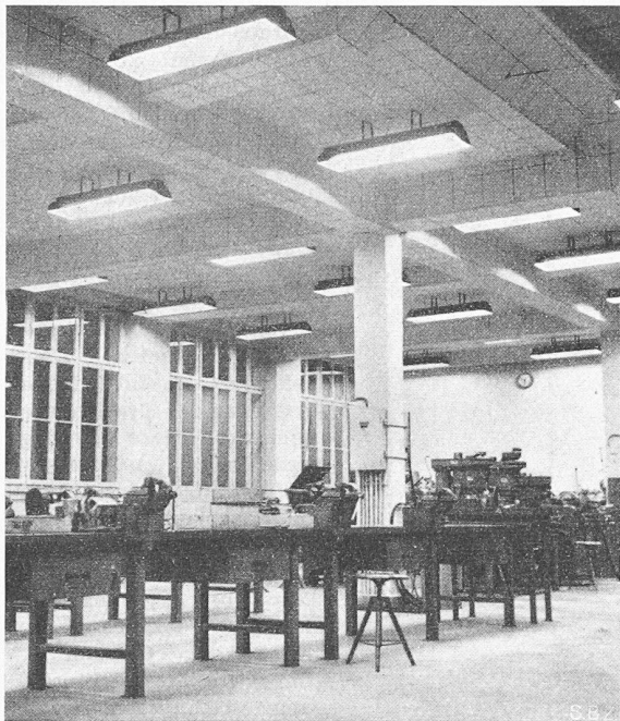
Bild 1. Fabrikbeleuchtung in einer mechanischen Werkstätte mit dreiflämmigen Leuchten für Fluoreszenzlampen TL 40 Watt. Mittlere Beleuchtungsstärke 350 Lux