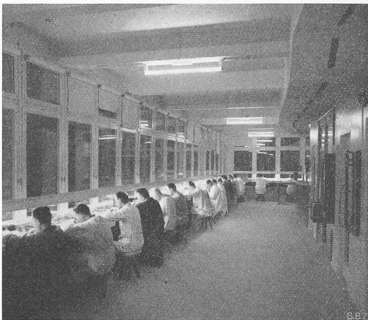
Bild 2. Spezialbeleuchtung in einer Uhrenfabrik mit aufwindbaren Leuchten in Einheiten von vier bis sechs Längen, bestückt mit Fluoreszenzlampen TL 40 Watt. Mittlere Beleuchtungsstärke auf den Arbeitsplätzen 1000 bis 2000 Lux. Am Tag werden die Leuchten an die Decken hochgezogen

Stoffe haben die Eigenschaft, noch lange, nachdem sie dem Einfluss der Erregerquelle entzogen sind, nachzuleuchten (Phosphoreszenz), andere verlieren ihre Leuchtwirkung mit der Entfernung der Erregerquelle (Fluoreszenz). Die meisten der vorkommenden Luminophore senden ihre Strahlung in einem mehr oder weniger beschränkten Spektralbereich aus, z. B. Kadmiumborat rot, Willemit grün, Magnesiumwolframat blau. Durch geeignete Mischung dieser Stoffe ist es möglich, jede beliebige Farbe und vor allem auch verschiedene Ausführungen von Weiss zu erzeugen. Da die meisten Fluoreszenz-Stoffe temperaturempfindlich sind, ist ihre Verwendung in der verhältnismässig kalten Niederdruckentladung besonders erfolgversprechend. Es wurden deshalb Quecksilberniederdruckröhren gebaut, (die ein reiches Mass an ultraviolett Strahlen aufweisen), welche auf der Innen-Seite mit Fluoreszenzpuder bestäubt sind. Sie sind auf dem Markt bekannt unter dem Ausdruck Fluoreszenz-Lampen. Solche Lampen werden heute in verschiedenen Längen, Leistungsstufen, Farben, Durchmessern und Lichtstrommengen gebaut. Ihre