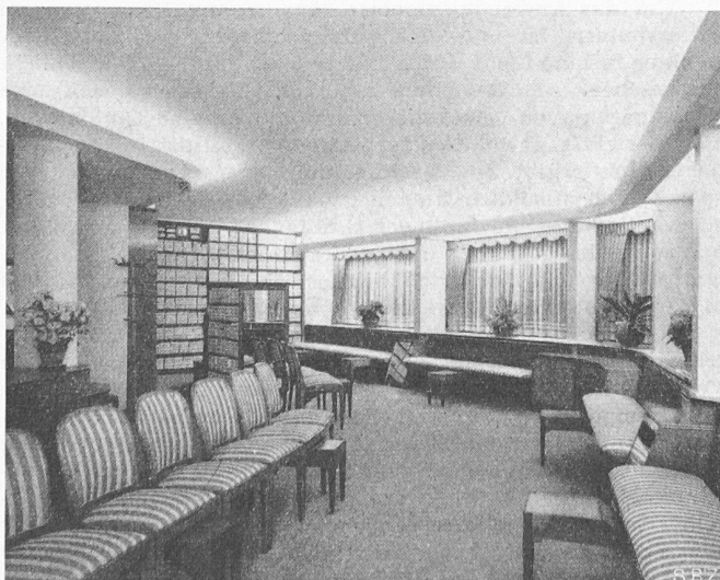
Bild 3. Beleuchtung eines Verkaufslokals mit Fluoreszenzlampen TL 40 Watt. Hauptlicht zwischen den Pfeilern, an den Fenstern und in der Decke, nach unten mit einem mattierten Glas abgeschirmt, zudem in den Hohlkehlen links und rechts des Raumes. Mittlere Beleuchtungsstärke 300 bis 500 Lux

Besonders begrüßenswert ist die in der letzten Zeit gemachte Feststellung einer vermehrten Zusammenarbeit zwischen Architekten und Lichttechnikern. Auf diese Weise kann das Beleuchtungsproblem in einem Neubau bei einem Minimum an Kosten und Umtrieben am besten gelöst werden. Nicht nur in Amerika, sondern auch in der Schweiz findet das neue Licht eine immer grössere Verbreitung. Bereits sind Tausende von Werkstätten, Bureaux, Ateliers usw. mit den neuen Lichtquellen beleuchtet, und überall sind dort, wo die Installationen gut durchdacht und einwandfrei ausgeführt wurden, sehr gute Resultate erzielt worden. Für eingehende technische Information sei verwiesen auf den Aufsatz des Verfassers im «Bulletin SEV» 1949, Nr. 3.