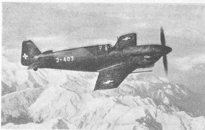
Bild 1. Ansicht des Jägers D3802 A im Flug

Wie liegen nun die Verhältnisse am Tré-la-Tête-Gletscher im Hinblick auf die Untergletscher-Wasserfassung? Die Zunge des rd. 7,2 km langen Eisstromes mit 10,8 \text{km}^2 Oberfläche reicht auf 1900 m Meereshöhe herunter, während der Wasserspiegel an der Entnahmestelle auf Kote 1921,50 m vorzusehen war. Da der Gletscher in eine steile Fels-Schlucht ausmündet, dürfte von Anfang an damit gerechnet werden, dass die Wasserfassung in nicht allzu grosser Entfernung vom Gletscherende erstellt werden könnte. Mit einem 300 m langen, durch das Eis vorgetriebenen Horizontalstollen wurde der Verlauf des Gletscherbaches unter dem Eis ermittelt und dabei festgestellt, dass dieser Bach eine tiefe, drei bis sechs Meter breite Erosionsrinne ausgefressen hatte. Der gesamte Gletscherabfluss konnte in dieser, übrigens stets eisfreien Felsrinne ohne besondere Schwierigkeiten hinter einer Ueberlaufstaumauer gefasst und durch einen Stollen abgeleitet werden, wie wenn es sich um die Wasserentnahme aus einem Wildbach unter freiem Himmel gehandelt hätte. Zudem weist die Sohle des Wasserlaufes unter dem Gletscherende ein so grosses Längsgefälle auf, dass die Nebeneinrichtungen der