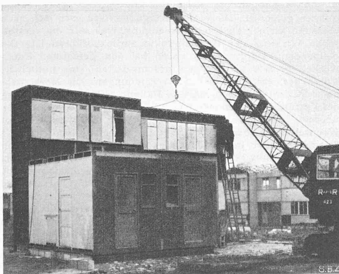
Bild 3. Die «working units» werden paarweise aufgestellt. Anschliessend werden auf deren Dach die Schrankfronten, Bädewannen usw. montiert und mit dem untern Teil verbunden. Rechts eines der reichlich eingesetzten Hebezeuge

Nun hat auch unser lieber Freund Fridolin plötzlich die