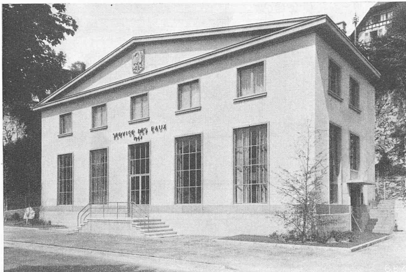
Bild 1. Das Seewasser-Pumpwerk der Stadt Neuenburg bei Champ-Bougin. Die neue Filteranlage befindet sich im nicht sichtbaren Anbau auf der Bergseite

70 kg/cm 2 . Für einen Teil der Leitung werden im Lande selbst hergestellte elektrogeweilte Rohre von 273 mm Innendurchmesser und 6,35 mm Wandstärke verwendet. Die einzelnen Stücke werden am Verlegungsort mit Spezialvorrichtungen elektrisch aneinander geschweisst. Zur Prüfung der Schweissung verwendet man u. a. die Magnetisierungsmethode mit Eisenoxydstaub, wozu besondere transportable Einrichtungen geschaffen wurden. Der Prüfung folgt eine Reinigung der äusseren Oberfläche und anschliessend ein Anstrich mit einem Bitumenpräparat. Darauf wird die Leitung mit einer besonderen Maschine mit einer Asphaltschicht von 5 mm Dicke umgeben, mit asphaltiertem Asbestgewebe und schliesslich mit asphaltiertem Papier umwickelt. Im Teilstück der Leitung von Comodoro Rivadavia bis Bahía Blanca sind alle 30 km, im zweiten Teil bis Buenos Aires alle 20 km ein Absperrorgan eingebaut. Nach Fertigstellen von Teilstücken von mindestens 10 km Länge wird eine zylinderförmige Bürste durchgezogen, um Unreinigkeiten zu entfernen. Der Staub wird nachher mit Druckluft von etwa 2,5 at ausgeblasen.