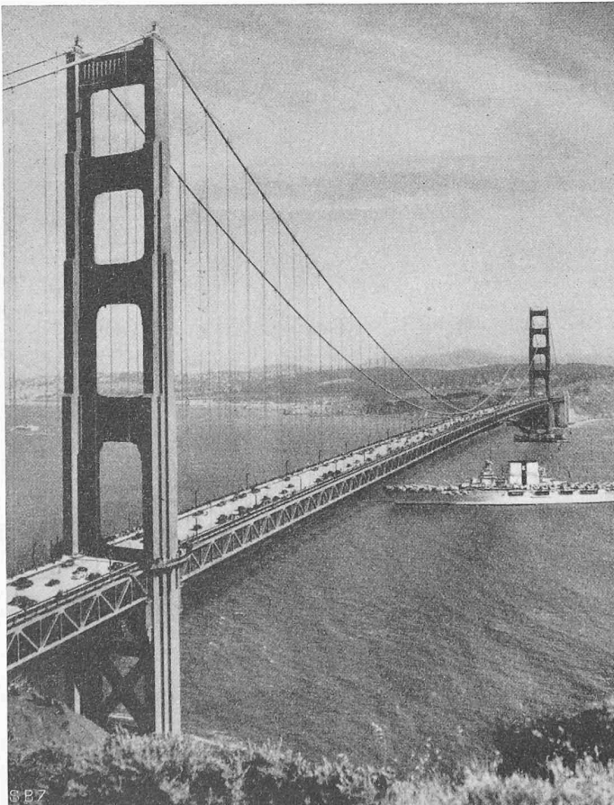
Bild 28. Golden Gate Brücke bei San Francisco