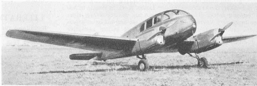
Das Sportflugzeug «Aero Ae 45»

Ueber bakteriologische Untersuchungsergebnisse an geschlossenen Trinkwasserbehältern berichtet Dr. S. Hoffmann, Hygiene-Institut der E. T. H. in «Strasse und Verkehr» Nr. 19/20 vom 26. Sept. 1947. Darnach wurden Behälter von 1 bis 4000 m 3 Inhalt während Beobachtungszeiten bis zu vier Jahren untersucht und festgestellt, dass an sich reines Trinkwasser nach einwandfreiem Einfüllen — am besten durch feste Leitungen — in einwandfreien Behältern ohne Kontaktnahme mit aussen keinerlei Einbusse seiner ursprünglichen Güte erfährt, auch wenn es über Jahre gelagert wird. Desinfektionsmassnahmen sind nur bei bakteriologisch schlechtem Wasser nötig. Hierfür wird Chlor verwendet, entweder in schwacher, an der Geruchschwelle liegender Konzentration (0,2 bis 0,45 mg/l, entsprechend 0,5 g Caporit pro m 3 ) oder in hoher Ueberdosierung und nachheriger Entchlorung durch Aktivkohle-Filtration, dies namentlich bei kleinen Behältern. Störend wirkt hierbei die Chloratmosphäre, während die bakteriologische Wirkung günstig ist. Man kann auch das Wasser mit Tonerde-Filterkerzen, am besten vor dem Gebrauch, reinigen, wobei aber diese Kerzen mit der Zeit verstopfen. Will man sie zum Regenerieren auskochen, so entstehen leicht Haarrisse, wodurch sie für Bakterien durchlässig werden. Nach-