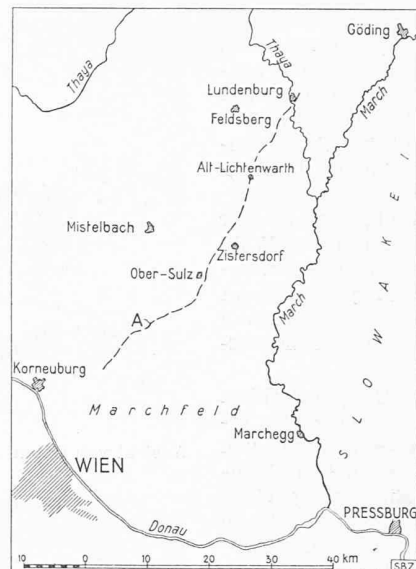
Bild 1. Das Erdölfeld von Zistersdorf A Steinbergbruch

Während des letzten Krieges steigerten die Deutschen zunächst die Schurftätigkeit aufs höchste. Nach dem Zusammenbruch des Russenfeldzuges stürzte sich der grosse Apparat der deutschen Erdölindustrie auf das Zisters-