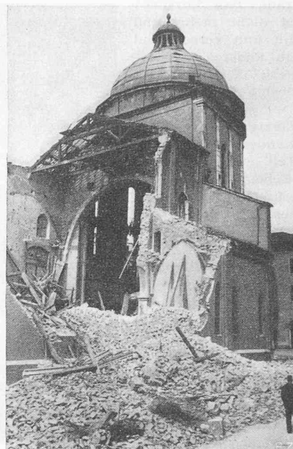
Bild 7. Der Dom nach dem Bombardement

die Säulenhalle des Hofes sind der Vernichtung entgangen. Vom Palazzo di Giustizia ist der Verputz am Hauptportal abgeschürft, die Südseite des Hofes bös mitgenommen, das Innere ausgebrannt. Schwer beschädigt ist auch die Barockkirche San Fedele.