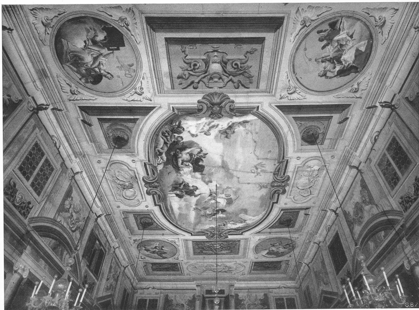
Das zerstörte Fresco Tiepolos im Palazzo Valmarana (San Faustino) in Vicenza