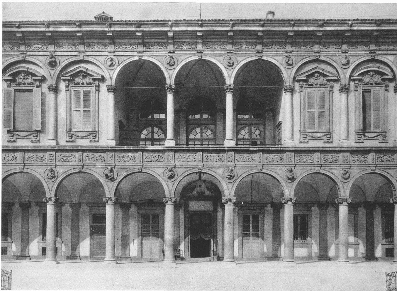
Zwei zerstörte Kunstwerke Mailands oben Ospedale maggiore (Arkaden bramantesk, Füllungen der Bogen des obern Stockwerks um 1600) unten Loggia Bramantes bei Sant' Ambrogio