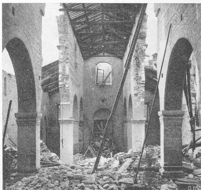
Bild 9. Verona, San Giovanni in Valle