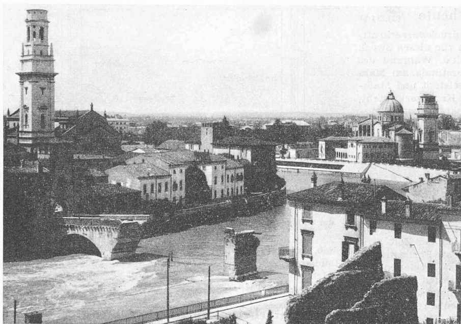
Bild 10. Verona, Reste der römischen Brücke

Nuova, del Palio und di San Zeno, obwohl in der am ärgsten betroffenen Zone gelegen, sind, wohl durch die seitlich vorspringenden Bastionen geschützt, ohne jeglichen Schaden davongekommen. San Zeno, der schönste romanische Bau Italiens, das Wunderwerk seines Portals, seiner Bronzetüren, seiner Chorschranken und Krypta, er ist uns erhalten geblieben und mit ihm auch die Altartafel Mantegnas auf dem Hochaltar, der Campanile und der romanische Kreuzgang.