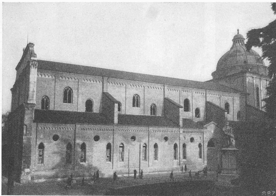
Bild 6. Der Dom von Vicenza nach der Wiederherstellung