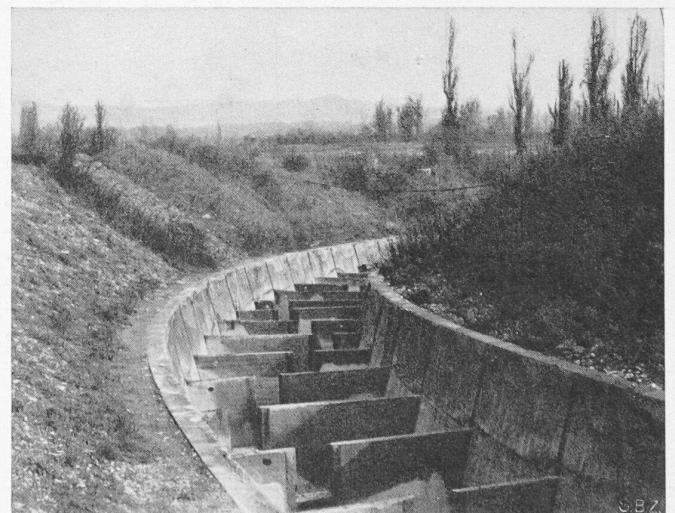
Bild 2. Blick in den neuen Fischpass des Stauwehrs Kembs