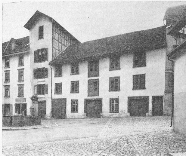
Der «Tümpfel» in Bischofszell, links schlecht erneuert, rechts im früheren Zustand

Abteilungen in dreigeschossigen Bautrakten zu einer harmonischen Gesamtanlage zusammenzufassen. Die Fassaden, die einen wohnlichen Charakter wahren, sind sehr gut. Bemerkenswert ist auch die Führung der obren Waidstrasse dem Waldrand entlang in der Richtung gegen die Wirtschaft Waid.