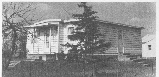
Bild 3. Kanadisches Haus, Holz

Die serienmässige Herstellung vorfabrizierter Gebäude erfordert eine theoretische und praktische Vorarbeit, die etwa der eines grossen Automobilwerks entspricht, das Wagen am laufenden Band fabrizieren will. In Noisy-le-Sec wird die Gelegenheit geschaffen, Theorie und Praxis, Erstrebt und Erreichtes anhand von naturgrossen Modellen, d. h. von bewohnbaren und zum Teil auch schon bewohnten Einfamilienhäusern zu vergleichen, die nicht nur aus verschiedenen (bisher 5) Ländern stam-