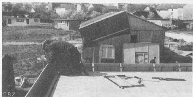
Bild 5. Schweizerhaus im Bau, hinten schwedisches Holzhaus