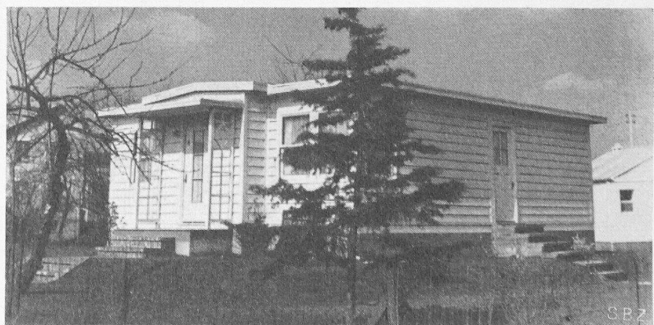
Bild 3. Kanadisches Haus, Holz

Die serienmässige Herstellung vorfabrizierter Gebäude erfordert eine theoretische und praktische Vorarbeit, die etwa der eines grossen Automobilwerks entspricht, das Wagen am laufenden Band fabrizieren will. In Noisy-le-Sec wird die Gelegenheit geschaffen, Theorie und Praxis, Erstrebt und Erreichtes anhand von naturgrossen Modellen, d. h. von bewohnbaren und zum Teil auch schon bewohnten Einfamilienhäusern zu vergleichen, die nicht nur aus verschiedenen (bisher 5) Ländern stam-