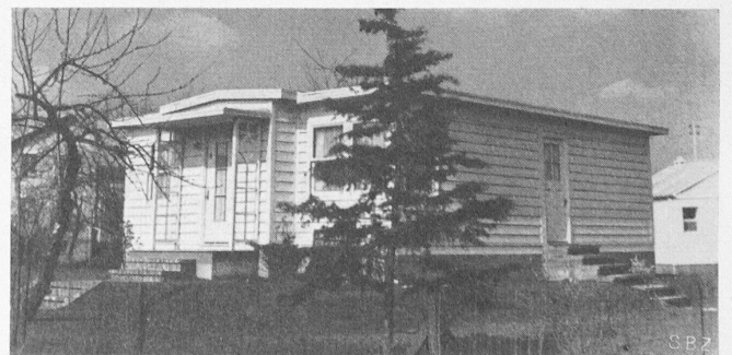
Bild 3. Kanadisches Haus, Holz

Die serienmässige Herstellung vorfabrizierter Gebäude erfordert eine theoretische und praktische Vorarbeit, die etwa der eines grossen Automobilwerks entspricht, das Wagen am laufenden Band fabrizieren will. In Noisy-le-Sec wird die Gelegenheit geschaffen, Theorie und Praxis, Erstrebt und Erreichtes anhand von naturgrossen Modellen, d. h. von bewohnbaren und zum Teil auch schon bewohnten Einfamilienhäusern zu vergleichen, die nicht nur aus verschiedenen (bisher 5) Ländern stam-