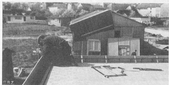
Bild 5. Schweizerhaus im Bau, hinten schwedisches Holzhaus