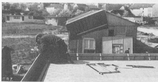
Bild 5. Schweizerhaus im Bau, hinten schwedisches Holzhaus