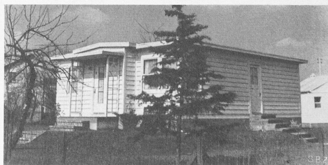
Bild 3. Kanadisches Haus, Holz

Die serienmässige Herstellung vorfabrizierter Gebäude erfordert eine theoretische und praktische Vorarbeit, die etwa der eines grossen Automobilwerks entspricht, das Wagen am laufenden Band fabrizieren will. In Noisy-le-Sec wird die Gelegenheit geschaffen, Theorie und Praxis, Erstrebtes und Erreichtes anhand von naturgrossen Modellen, d. h. von bewohnbaren und zum Teil auch schon bewohnten Einfamilienhäusern zu vergleichen, die nicht nur aus verschiedenen (bisher 5) Ländern stam-