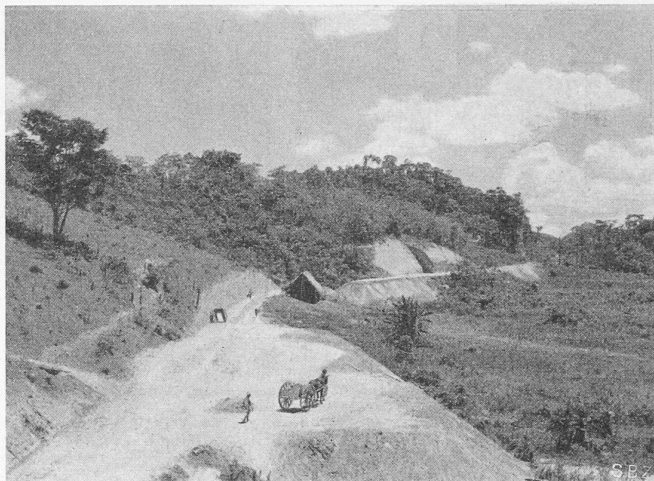
Fig. 15. Correction de la ligne à 91 km de Vitoria

particulièrement difficiles de recrutement local de ce personnel, il faut prévoir le recrutement d'un personnel suffisamment préparé et, en particulier, créer des centres d'instruction et d'entraînement pour toutes les branches d'activité de ce personnel.