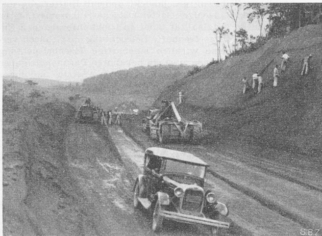
Fig. 14. Correction de la ligne à 21 km de Vitoria. Travail mécanique avec machines américaines